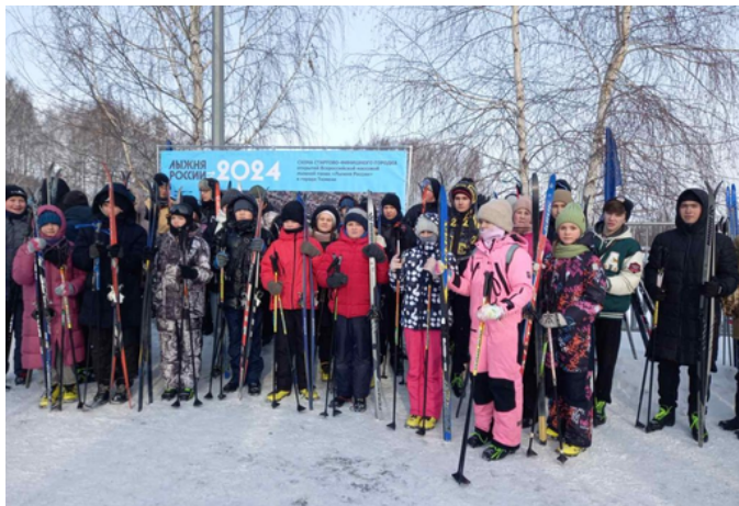
автор: Киселёва Яна, ученица 8"Б" класса

Желающие смогли выполнить нормативы ГТО. Вместе с горожанами, школьниками и учителями на массовую дистанцию вышли представители администрации, городской думы и вузов.