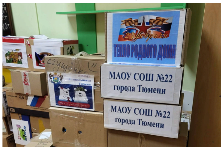
автор: Доценко Дарья, ученица 7 "В" класса

В итоге были собраны посылки от учеников нашей школы, которые передали в волонтерский штаб #МыВместе. Благодарим всех за участие!