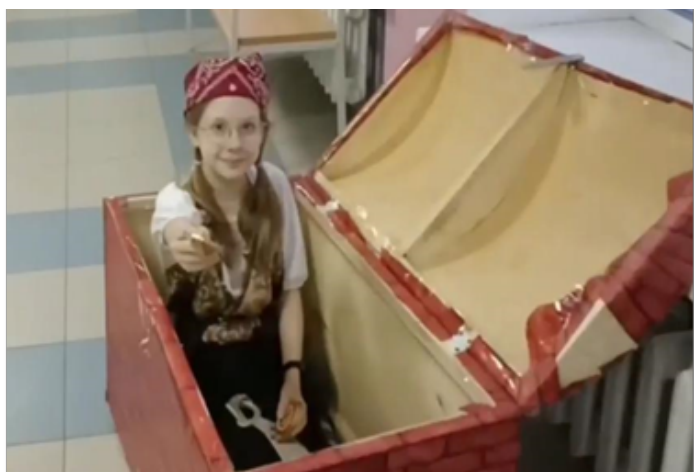
автор: Киселёва Яна, ученица 7 "Б" класса

8 марта - Международный женский день - всемирный день женщин, в который помимо чествования прекрасной половины человечества также отмечаются достижения женщин в политической, экономической и социальной областях, празднуется прошлое, настоящее и будущее женщин планеты. В нашей школе 8 марта с самого утра активисты РДДМ в образе пиратов встречали педагогов и дарили им золотые монеты. Затем для наших любимых учителей прошел праздничный концерт с весёлыми номерами, подготовленными учениками и педагогами школы. Также в течение дня в школе работала ПОЧТА, организованная волонтерским отрядом "Мы вместе". У всех была возможность написать праздничное поздравление своему любимому учителю.